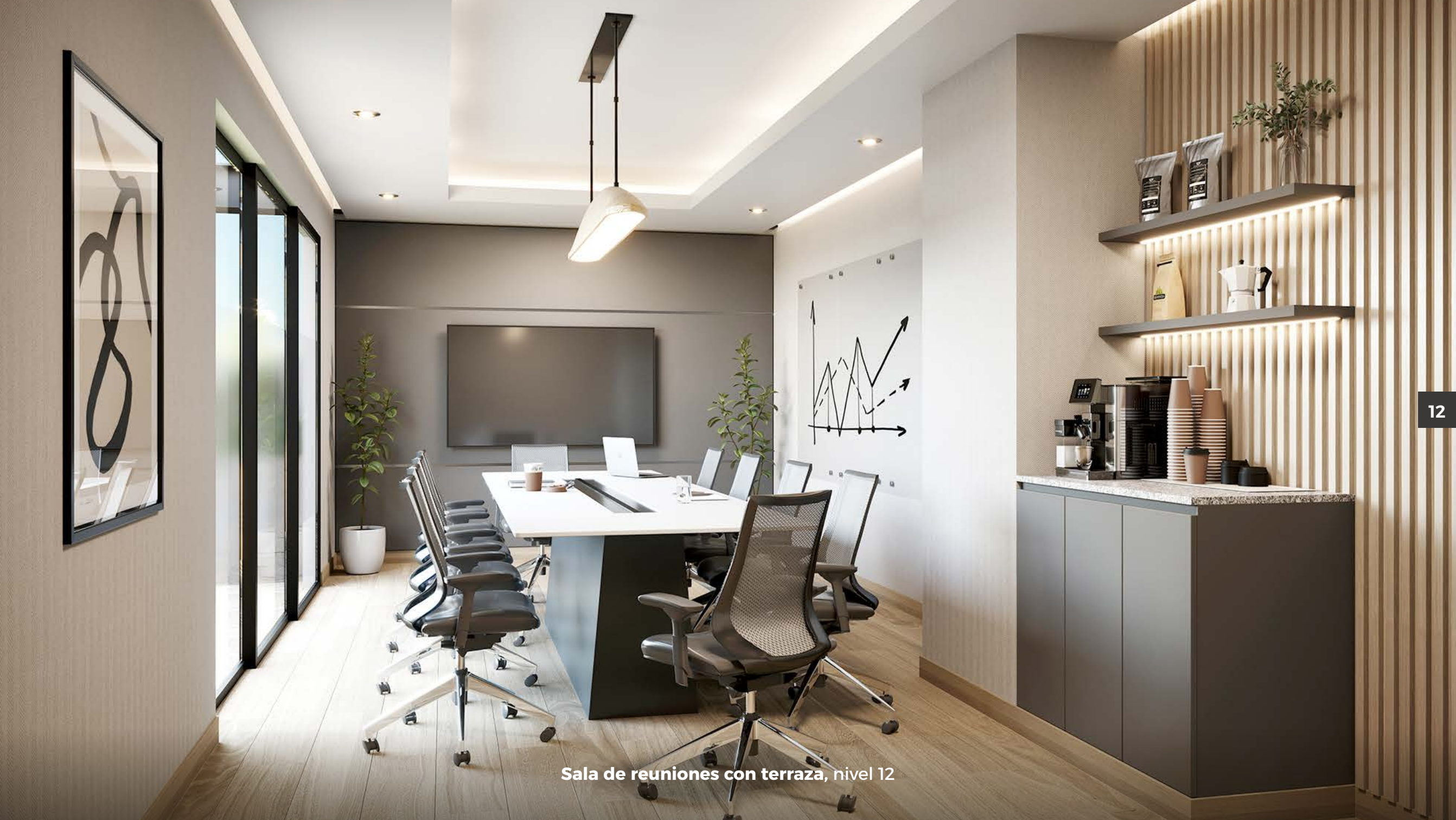
Sala de reuniones con terraza, nivel 12