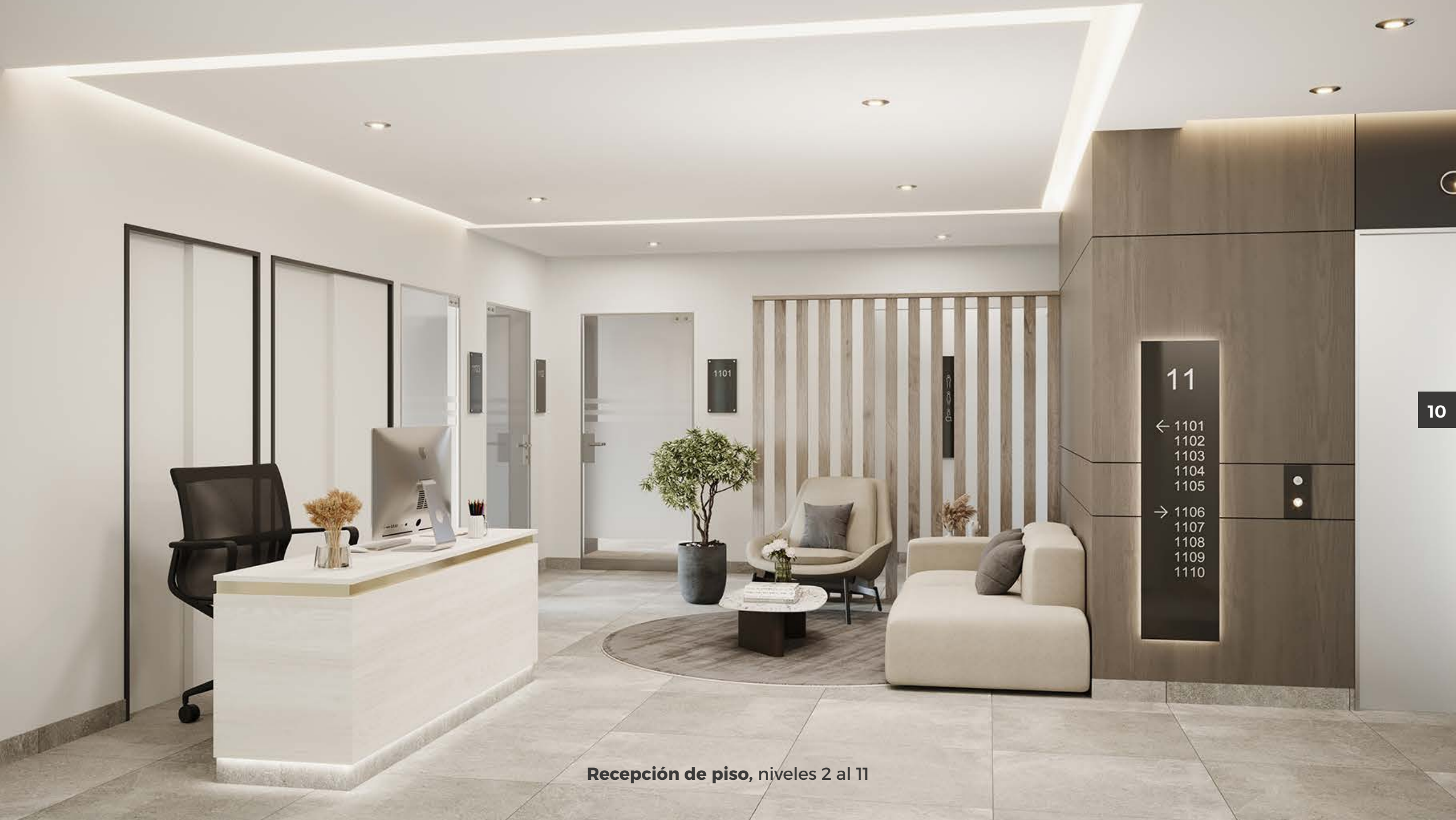
Recepción de piso, niveles 2 al 11