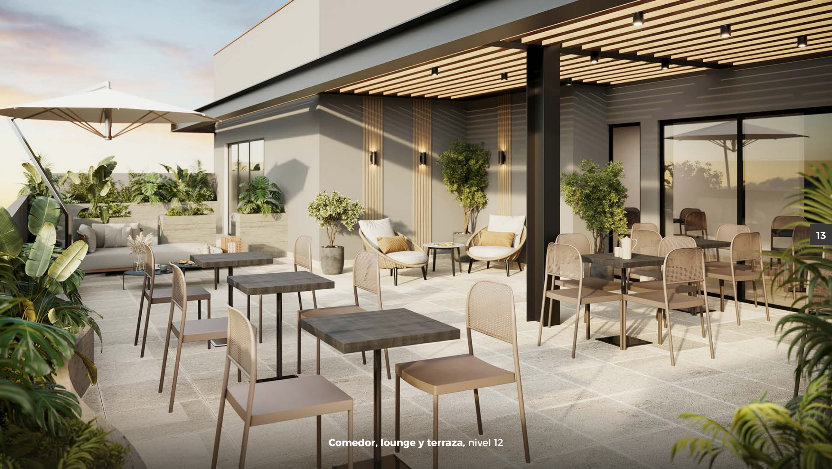
Comedor, lounge y terraza, nivel 12